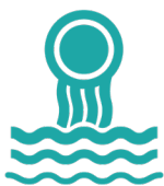
Escorrentía de aguas pluviales

Se prevé que la escorrentía de las aguas superficiales aumente debido a los cambios en el uso del suelo y en los patrones climáticos.